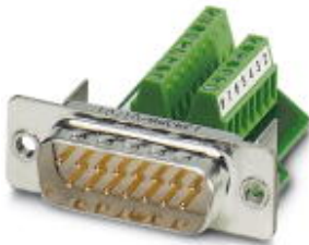
D-SUB-Kontakteinsatz, Shell-Größe 2, mit 15 Signalkontakten, Kontaktart Stift, Schraubanschluss, gerade, für Anbaurahmen und Tüllengehäuse in Schutzart IP67

Bitte beachten Sie, dass die hier angegebenen Daten dem Online-Katalog entnommen sind. Die vollständigen Informationen und Daten entnehmen Sie bitte der Anwenderdokumentation. Es gelten die Allgemeinen Nutzungsbedingungen für Internet-Downloads. ( http://download.phoenixcontact.de )