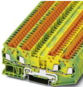
Schutzleiter-Reihenklemme, Anschlussart: Schnellanschluss, Querschnitt: 0,25 mm 2 - 1,5 mm 2 , AWG: 24 - 16, Breite: 5,2 mm, Farbe: grün-gelb, Montageart: NS 35/7,5, NS 35/7,5

Bitte beachten Sie, dass die hier angegebenen Daten dem Online-Katalog entnommen sind. Die vollständigen Informationen und Daten entnehmen Sie bitte der Anwenderdokumentation. Es gelten die Allgemeinen Nutzungsbedingungen für Internet-Downloads. ( http://download.phoenixcontact.de )