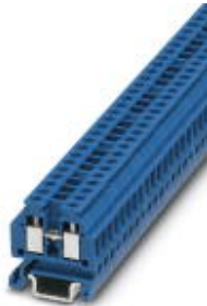
Durchgangsklemme, Anschlussart: Schraubanschluss, Querschnitt: 0,14 mm 2 - 1,5 mm 2 , AWG: 26 - 16, Breite: 4,2 mm, Farbe: blau, Montageart: NS 15

Bitte beachten Sie, dass die hier angegebenen Daten dem Online-Katalog entnommen sind. Die vollständigen Informationen und Daten entnehmen Sie bitte der Anwenderdokumentation. Es gelten die Allgemeinen Nutzungsbedingungen für Internet-Downloads. ( http://download.phoenixcontact.de )