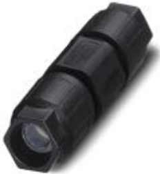
QUICKON-Leitungsverbinder, schwarz, 4-polig ohne PE, 0,75 mm 2 ... 1,5 mm 2 / 500 V / 15 A, für Kabeldurchmesser 6 mm ... 12 mm.

Bitte beachten Sie, dass die hier angegebenen Daten dem Online-Katalog entnommen sind. Die vollständigen Informationen und Daten entnehmen Sie bitte der Anwenderdokumentation. Es gelten die Allgemeinen Nutzungsbedingungen für Internet-Downloads. ( http://download.phoenixcontact.de )