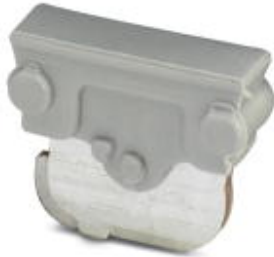
Ersatzmesser, Länge: 10,5 mm, Breite: 4 mm, Farbe: grau

Bitte beachten Sie, dass die hier angegebenen Daten dem Online-Katalog entnommen sind. Die vollständigen Informationen und Daten entnehmen Sie bitte der Anwenderdokumentation. Es gelten die Allgemeinen Nutzungsbedingungen für Internet-Downloads. ( http://download.phoenixcontact.de )