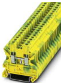
Universal-Schutzleiterklemme, Anschlussart: Schraubanschluss, Querschnitt: 0,14 mm 2 - 6 mm 2 , AWG: 26 - 10, Breite: 6,2 mm, Farbe: grün-gelb, Montageart: NS 35/7,5, NS 35/15

Bitte beachten Sie, dass die hier angegebenen Daten dem Online-Katalog entnommen sind. Die vollständigen Informationen und Daten entnehmen Sie bitte der Anwenderdokumentation. Es gelten die Allgemeinen Nutzungsbedingungen für Internet-Downloads. ( http://download.phoenixcontact.de )