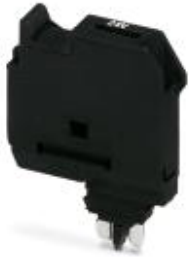
Sicherungsstecker mit Leuchtanzeige für 12-30 V DC, 0,31-0,95 mA, Breite 6,2 mm, Farbe schwarz

Bitte beachten Sie, dass die hier angegebenen Daten dem Online-Katalog entnommen sind. Die vollständigen Informationen und Daten entnehmen Sie bitte der Anwenderdokumentation. Es gelten die Allgemeinen Nutzungsbedingungen für Internet-Downloads. ( http://download.phoenixcontact.de )