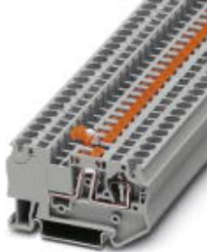
Messer-Trennklemme, Anschlussart: Zugfederanschluss, Querschnitt: 0,08 mm 2 - 6 mm 2 , AWG: 28 - 10, Nennstrom: 20 A, Nennspannung: 400 V, Länge: 61,5 mm, Breite: 6,2 mm, Farbe: grau, Montage: NS 35/7,5, NS 35/15

Bitte beachten Sie, dass die hier angegebenen Daten dem Online-Katalog entnommen sind. Die vollständigen Informationen und Daten entnehmen Sie bitte der Anwenderdokumentation. Es gelten die Allgemeinen Nutzungsbedingungen für Internet-Downloads. ( http://download.phoenixcontact.de )