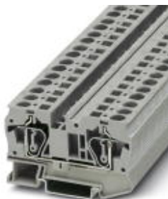
Zugfeder-Durchgangsklemme, Anschlussart: Zugfederanschluss, Querschnitt: 0,2 mm 2 - 10 mm 2 , AWG: 24 - 8, Breite: 8,2 mm, Farbe: grau, Montageart: NS 35/7,5, NS 35/15

Bitte beachten Sie, dass die hier angegebenen Daten dem Online-Katalog entnommen sind. Die vollständigen Informationen und Daten entnehmen Sie bitte der Anwenderdokumentation. Es gelten die Allgemeinen Nutzungsbedingungen für Internet-Downloads. ( http://download.phoenixcontact.de )