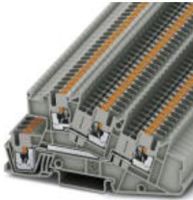
Installationsetagenklemme, Push-in-Anschluss, Querschnitt: 0,14 mm 2 - 4 mm 2 , AWG: 26 - 12, Breite: 5,2 mm, Farbe: grau, Montageart: NS 35/7,5, NS 35/15

Bitte beachten Sie, dass die hier angegebenen Daten dem Online-Katalog entnommen sind. Die vollständigen Informationen und Daten entnehmen Sie bitte der Anwenderdokumentation. Es gelten die Allgemeinen Nutzungsbedingungen für Internet-Downloads. ( http://download.phoenixcontact.de )