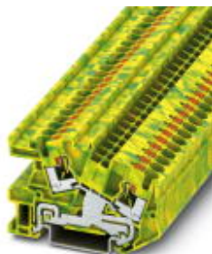
Installationsklemme, Push-in-Anschluss, Querschnitt: 0,2 mm 2 - 6 mm 2 , AWG: 24 - 10, Breite: 6,2 mm, Farbe: grün-gelb, Montageart: NS 35/7,5, NS 35/15

Bitte beachten Sie, dass die hier angegebenen Daten dem Online-Katalog entnommen sind. Die vollständigen Informationen und Daten entnehmen Sie bitte der Anwenderdokumentation. Es gelten die Allgemeinen Nutzungsbedingungen für Internet-Downloads. ( http://download.phoenixcontact.de )