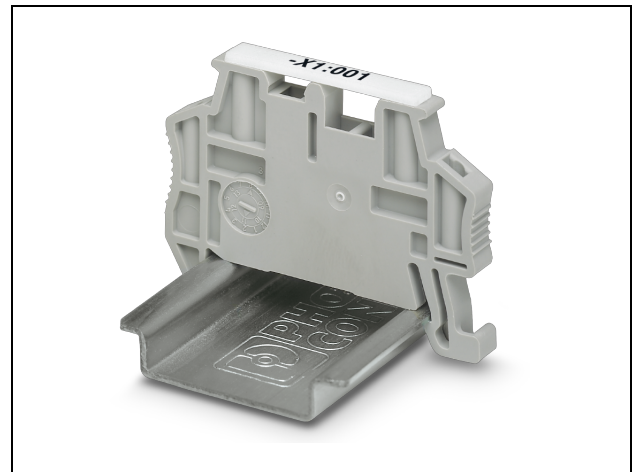
Bild 1 CLIPFIX 35-5 mit ZB 5

Der Endhalter bietet Parkmöglichkeiten zur Aufnahme von FBS-Steckbrücken und Prüfsteckern. Zusätzlich ist er im Verbund mit ST- und QTC-Klemmen durchbrückbar.