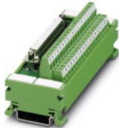
VARIOFACE-Modul, mit Schraubanschluss und D-Subminiatur-Buchsenleiste, zur Montage auf NS 35/7,5, Polzahl 37

Bitte beachten Sie, dass die hier angegebenen Daten dem Online-Katalog entnommen sind. Die vollständigen Informationen und Daten entnehmen Sie bitte der Anwenderdokumentation. Es gelten die Allgemeinen Nutzungsbedingungen für Internet-Downloads. ( http://download.phoenixcontact.de )