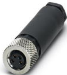
Steckverbinder, 4-polig, Buchse gerade M8, A-kodiert, Schraubanschluss, Rändelmaterial: Messing, vernickelt, Kabelaußendurchmesser 3,5 mm ... 5 mm

Bitte beachten Sie, dass die hier angegebenen Daten dem Online-Katalog entnommen sind. Die vollständigen Informationen und Daten entnehmen Sie bitte der Anwenderdokumentation. Es gelten die Allgemeinen Nutzungsbedingungen für Internet-Downloads. ( http://download.phoenixcontact.de )