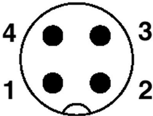
Polbild Stecker M12, 4-polig, A-kodiert, Ansicht Stiftseite