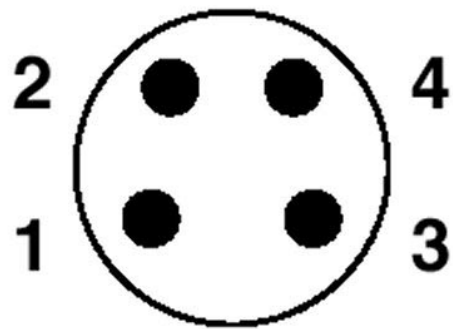
Polbild Stecker M8, 4-polig, Ansicht Stiftseite