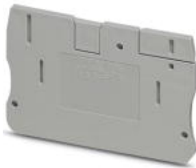
Abschlussdeckel, Länge: 57,7 mm, Breite: 2,2 mm, Höhe: 42 mm, Farbe: grau

Bitte beachten Sie, dass die hier angegebenen Daten dem Online-Katalog entnommen sind. Die vollständigen Informationen und Daten entnehmen Sie bitte der Anwenderdokumentation. Es gelten die Allgemeinen Nutzungsbedingungen für Internet-Downloads. ( http://download.phoenixcontact.de )