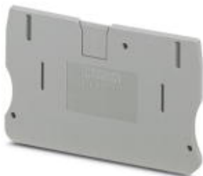
Abschlussdeckel, Länge: 67,7 mm, Breite: 2,2 mm, Höhe: 42,6 mm, Farbe: grau

Bitte beachten Sie, dass die hier angegebenen Daten dem Online-Katalog entnommen sind. Die vollständigen Informationen und Daten entnehmen Sie bitte der Anwenderdokumentation. Es gelten die Allgemeinen Nutzungsbedingungen für Internet-Downloads. ( http://download.phoenixcontact.de )