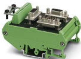
Passiver-RS-485-T-Verteiler, bestückt mit einer 9-poligen D-SUB-Stiftleiste und zwei 9-poligen D-SUB-Buchsenleisten

Bitte beachten Sie, dass die hier angegebenen Daten dem Online-Katalog entnommen sind. Die vollständigen Informationen und Daten entnehmen Sie bitte der Anwenderdokumentation. Es gelten die Allgemeinen Nutzungsbedingungen für Internet-Downloads. ( http://download.phoenixcontact.de )