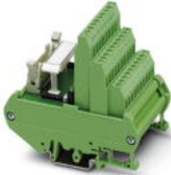
VARIOFACE-Initiatormodul, zum Anschluss von 8 PNP-Initiatoren, mit Leuchtanzeige

Bitte beachten Sie, dass die hier angegebenen Daten dem Online-Katalog entnommen sind. Die vollständigen Informationen und Daten entnehmen Sie bitte der Anwenderdokumentation. Es gelten die Allgemeinen Nutzungsbedingungen für Internet-Downloads. ( http://download.phoenixcontact.de )