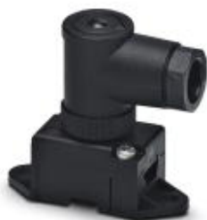
AS-Interface Verteiler in Schutzart IP67 für 1 Flachleitung, 2-polig, mit Schraubanschluss, gewinkelt

Bitte beachten Sie, dass die hier angegebenen Daten dem Online-Katalog entnommen sind. Die vollständigen Informationen und Daten entnehmen Sie bitte der Anwenderdokumentation. Es gelten die Allgemeinen Nutzungsbedingungen für Internet-Downloads. ( http://download.phoenixcontact.de )