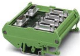
Passiver-RS-485-T-Verteiler, bestückt mit einer 9-poligen D-SUB-Stiftleiste und fünf 9-poligen D-SUB-Buchsenleisten

Bitte beachten Sie, dass die hier angegebenen Daten dem Online-Katalog entnommen sind. Die vollständigen Informationen und Daten entnehmen Sie bitte der Anwenderdokumentation. Es gelten die Allgemeinen Nutzungsbedingungen für Internet-Downloads. ( http://download.phoenixcontact.de )