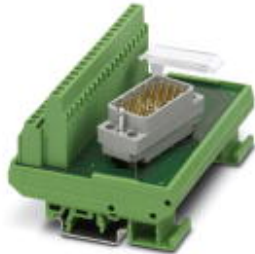
VARIOFACE-Modul, für ELCO-Steckverbinder, zur Montage auf NS 35/7,5 oder NS 32, mit Stiftleiste 8016 links, Polzahl 38

Bitte beachten Sie, dass die hier angegebenen Daten dem Online-Katalog entnommen sind. Die vollständigen Informationen und Daten entnehmen Sie bitte der Anwenderdokumentation. Es gelten die Allgemeinen Nutzungsbedingungen für Internet-Downloads. ( http://download.phoenixcontact.de )