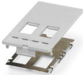
Datenfrontplatte, Kunststoff mit Schirmblech, für 2x RJ mit modularem System (Keystone)

Bitte beachten Sie, dass die hier angegebenen Daten dem Online-Katalog entnommen sind. Die vollständigen Informationen und Daten entnehmen Sie bitte der Anwenderdokumentation. Es gelten die Allgemeinen Nutzungsbedingungen für Internet-Downloads. ( http://download.phoenixcontact.de )