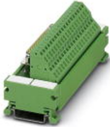
VARIOFACE-Modul, mit Zugfederanschluss und D-Subminiatur-Buchsenleiste, zur Montage auf NS 35/7,5, Polzahl 50

Bitte beachten Sie, dass die hier angegebenen Daten dem Online-Katalog entnommen sind. Die vollständigen Informationen und Daten entnehmen Sie bitte der Anwenderdokumentation. Es gelten die Allgemeinen Nutzungsbedingungen für Internet-Downloads. ( http://download.phoenixcontact.de )