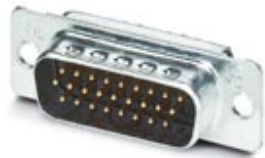
D-SUB-Kontakteinsatz, Shell-Größe 2, mit 26 Signalkontakten, Kontaktart Stift, mit Lötkelch, gerade, Befestigung mittels Bohrung 3 mm, für Anbaurahmen und Tüllengehäuse VS-15-...

Bitte beachten Sie, dass die hier angegebenen Daten dem Online-Katalog entnommen sind. Die vollständigen Informationen und Daten entnehmen Sie bitte der Anwenderdokumentation. Es gelten die Allgemeinen Nutzungsbedingungen für Internet-Downloads. ( http://download.phoenixcontact.de )