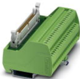
VARIOFACE-Übergabemodul für Siemens SIMATIC® S7-300, mit SIMATIC®-spezifischer Beschriftung (1 - 40), Schraubanschluss, Modulbreite: 106.1 mm

Bitte beachten Sie, dass die hier angegebenen Daten dem Online-Katalog entnommen sind. Die vollständigen Informationen und Daten entnehmen Sie bitte der Anwenderdokumentation. Es gelten die Allgemeinen Nutzungsbedingungen für Internet-Downloads. ( http://download.phoenixcontact.de )