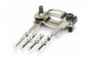
Schirmanschluss für zwei geschirmte Leitungen, inkl. zwei lose Buchsen-Crimpkontakte für PROFIBUS-Leitungen.

Bitte beachten Sie, dass die hier angegebenen Daten dem Online-Katalog entnommen sind. Die vollständigen Informationen und Daten entnehmen Sie bitte der Anwenderdokumentation. Es gelten die Allgemeinen Nutzungsbedingungen für Internet-Downloads. ( http://download.phoenixcontact.de )