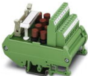
VARIOFACE-Modul, für 8 Kanäle mit je einer zusätzlichen Klemme und Sicherung pro Signal, (gemeinsames Minuspotenzial)

Bitte beachten Sie, dass die hier angegebenen Daten dem Online-Katalog entnommen sind. Die vollständigen Informationen und Daten entnehmen Sie bitte der Anwenderdokumentation. Es gelten die Allgemeinen Nutzungsbedingungen für Internet-Downloads. ( http://download.phoenixcontact.de )