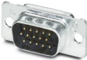
D-SUB-Kontakteinsatz, Shell-Größe 1, mit 15 Signalkontakten, Kontaktart Stift, mit Lötkelch, gerade, Befestigung mittels Bohrung 3 mm, für Anbaurahmen VS-09-...

Bitte beachten Sie, dass die hier angegebenen Daten dem Online-Katalog entnommen sind. Die vollständigen Informationen und Daten entnehmen Sie bitte der Anwenderdokumentation. Es gelten die Allgemeinen Nutzungsbedingungen für Internet-Downloads. ( http://download.phoenixcontact.de )