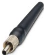
QUICKON-FSMA-Stecker, für Polymerfasern 4-teiliges Set

Bitte beachten Sie, dass die hier angegebenen Daten dem Online-Katalog entnommen sind. Die vollständigen Informationen und Daten entnehmen Sie bitte der Anwenderdokumentation. Es gelten die Allgemeinen Nutzungsbedingungen für Internet-Downloads. ( http://download.phoenixcontact.de )