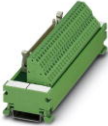
VARIOFACE-Modul, mit Zugfederanschluss und Flachbandkabel-Steckverbinder, zur Montage auf NS 35/7,5, Polzahl 26

Bitte beachten Sie, dass die hier angegebenen Daten dem Online-Katalog entnommen sind. Die vollständigen Informationen und Daten entnehmen Sie bitte der Anwenderdokumentation. Es gelten die Allgemeinen Nutzungsbedingungen für Internet-Downloads. ( http://download.phoenixcontact.de )