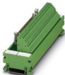
VARIOFACE-Modul, mit Zugfederanschluss und Flachbandkabel-Steckverbinder, zur Montage auf NS 35/7,5, Polzahl 10

Bitte beachten Sie, dass die hier angegebenen Daten dem Online-Katalog entnommen sind. Die vollständigen Informationen und Daten entnehmen Sie bitte der Anwenderdokumentation. Es gelten die Allgemeinen Nutzungsbedingungen für Internet-Downloads. ( http://download.phoenixcontact.de )