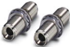
Kupplung, Set bestehend aus 2 Kupplungen zur Verbindung von F-SMA-Steckern

Bitte beachten Sie, dass die hier angegebenen Daten dem Online-Katalog entnommen sind. Die vollständigen Informationen und Daten entnehmen Sie bitte der Anwenderdokumentation. Es gelten die Allgemeinen Nutzungsbedingungen für Internet-Downloads. ( http://download.phoenixcontact.de )