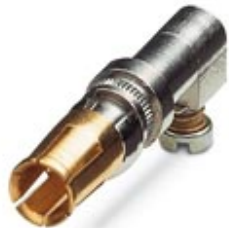
POWER-Kontakt, für D-SUB-Kombinationseinsätze, Schraubanschluss, Buchse, gerade, Bemessungsstrom 20 A, vergoldet

Bitte beachten Sie, dass die hier angegebenen Daten dem Online-Katalog entnommen sind. Die vollständigen Informationen und Daten entnehmen Sie bitte der Anwenderdokumentation. Es gelten die Allgemeinen Nutzungsbedingungen für Internet-Downloads. ( http://download.phoenixcontact.de )