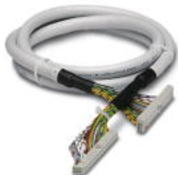
Konfektioniertes Rundkabel, mit zwei 50-poligen Federleisten (1:1 Verbindung) , u. a. zur Übergabe von 32 Kanälen, Kabellänge: 5 m

Bitte beachten Sie, dass die hier angegebenen Daten dem Online-Katalog entnommen sind. Die vollständigen Informationen und Daten entnehmen Sie bitte der Anwenderdokumentation. Es gelten die Allgemeinen Nutzungsbedingungen für Internet-Downloads. ( http://download.phoenixcontact.de )