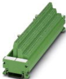
VARIOFACE-COMPACT-LINE, Initiator-Modul zum Anschluss von 32 PNP-Initiatoren, zur Montage auf Tragschiene NS 35/7,5, Schraubanschluss

Bitte beachten Sie, dass die hier angegebenen Daten dem Online-Katalog entnommen sind. Die vollständigen Informationen und Daten entnehmen Sie bitte der Anwenderdokumentation. Es gelten die Allgemeinen Nutzungsbedingungen für Internet-Downloads. ( http://download.phoenixcontact.de )