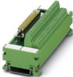
VARIOFACE-Modul, mit Schraubanschluss und D-Subminiatur-Buchsenleiste, zur Montage auf NS 35/7,5, Polzahl 50 (keine fortlaufende Beschriftung)

Bitte beachten Sie, dass die hier angegebenen Daten dem Online-Katalog entnommen sind. Die vollständigen Informationen und Daten entnehmen Sie bitte der Anwenderdokumentation. Es gelten die Allgemeinen Nutzungsbedingungen für Internet-Downloads. ( http://download.phoenixcontact.de )