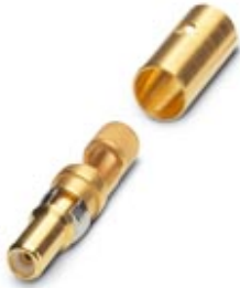
Koax-Kontakt, für D-SUB-Kombinationseinsätze, Lötkelch, Stift, gerade, für Kabel RG 58, vergoldet

Bitte beachten Sie, dass die hier angegebenen Daten dem Online-Katalog entnommen sind. Die vollständigen Informationen und Daten entnehmen Sie bitte der Anwenderdokumentation. Es gelten die Allgemeinen Nutzungsbedingungen für Internet-Downloads. ( http://download.phoenixcontact.de )