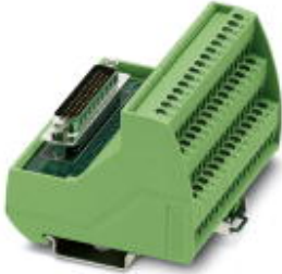
VARIOFACE-Modul, mit Schraubanschluss und High-Density-D-SUB-Miniatur-Stiftleiste, zur Montage auf NS 35-Tragschienen, Polzahl: 26, Breite: 79 mm

Bitte beachten Sie, dass die hier angegebenen Daten dem Online-Katalog entnommen sind. Die vollständigen Informationen und Daten entnehmen Sie bitte der Anwenderdokumentation. Es gelten die Allgemeinen Nutzungsbedingungen für Internet-Downloads. ( http://download.phoenixcontact.de )