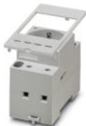
Schutzkontaktsteckdose, ausschließlich für Serviceinterface Artikel-Nr. 1656482 und 1656495, Kunststoff, für Frankreich

Bitte beachten Sie, dass die hier angegebenen Daten dem Online-Katalog entnommen sind. Die vollständigen Informationen und Daten entnehmen Sie bitte der Anwenderdokumentation. Es gelten die Allgemeinen Nutzungsbedingungen für Internet-Downloads. ( http://download.phoenixcontact.de )