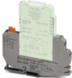
Ex-Grundklemme, mit Messertrennung und integrierter Temperaturmessung der Eingangsklemmen zur Kaltstellenkompensation

Bitte beachten Sie, dass die hier angegebenen Daten dem Online-Katalog entnommen sind. Die vollständigen Informationen und Daten entnehmen Sie bitte der Anwenderdokumentation. Es gelten die Allgemeinen Nutzungsbedingungen für Internet-Downloads. ( http://download.phoenixcontact.de )