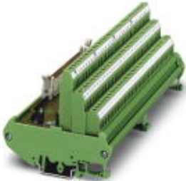
VARIOFACE-Initiatormodul, zum Anschluss von 32 PNP-Initiatoren

Bitte beachten Sie, dass die hier angegebenen Daten dem Online-Katalog entnommen sind. Die vollständigen Informationen und Daten entnehmen Sie bitte der Anwenderdokumentation. Es gelten die Allgemeinen Nutzungsbedingungen für Internet-Downloads. ( http://download.phoenixcontact.de )