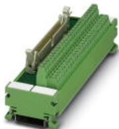
VARIOFACE-Modul, mit Schraubanschluss und Flachbandkabel-Steckverbinder, zur Montage auf NS 35/7,5, Polzahl 10

Bitte beachten Sie, dass die hier angegebenen Daten dem Online-Katalog entnommen sind. Die vollständigen Informationen und Daten entnehmen Sie bitte der Anwenderdokumentation. Es gelten die Allgemeinen Nutzungsbedingungen für Internet-Downloads. ( http://download.phoenixcontact.de )