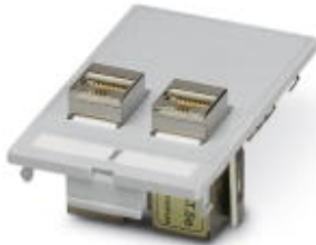
Datenfrontplatte mit Kontakteinsätzen, Kunststoff, 2x D-SUB 9, Buchse/Stift

Bitte beachten Sie, dass die hier angegebenen Daten dem Online-Katalog entnommen sind. Die vollständigen Informationen und Daten entnehmen Sie bitte der Anwenderdokumentation. Es gelten die Allgemeinen Nutzungsbedingungen für Internet-Downloads. ( http://download.phoenixcontact.de )