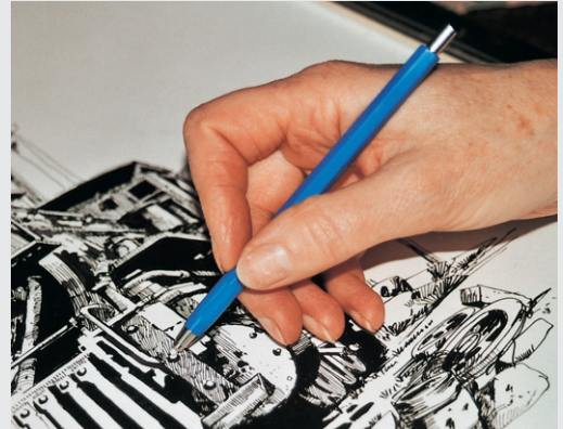
„Standard“ – Bearbeiten von Tuschezeichnungen o.ä.

Für feine Arbeiten, z.B. Reinigen und Entfernen von Tusche-/Tinte und Bleistiftstrichen auf Transparentpapier, Karton, Metall o.ä.; Einsatz: Glasfaser