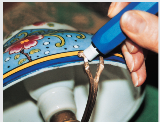
„Profi“ – Reinigen/Polieren von Edelmetallteilen

Für den Einsatz auf größeren Flächen z.B. Reinigung /Entrosten und Polieren von Metallteilen; Einsatz: Glasfaser