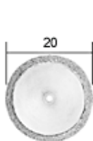
NO 28 840