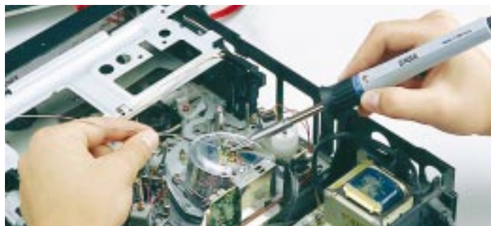
Konventionelles Lötten mit dem Basic tool 60

Der handliche LötKolben ERSÄ Basic tool 60 heizt in nur 60 Sekunden von Raumtemperatur auf 280°C auf. Ein weiteres Highlight in puncto Anwenderfreundlichkeit ist das ergonomische, vom IndustrieForum in Hannover prämierte Design: Alle Bedienelemente sind frontseitig positioniert, die Bedienfront ist entsprechend der Sehachse geneigt. Für entsprechende Bauteilesicherheit sorgt eine hochohmige mit der Lötspitze verbundene Potentialausgleichsbuchse. Durch die breite Auswahl an innenbeheizten ERSÄDUR-