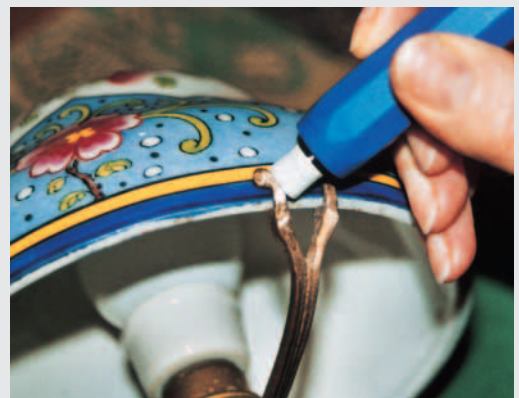
„Profi“ – Reinigen/Polieren von Edelmetallteilen

Für den Einsatz auf größeren Flächen z.B. Reinigung /Entrosten und Polieren von Metallteilen; Einsatz: Glasfaser