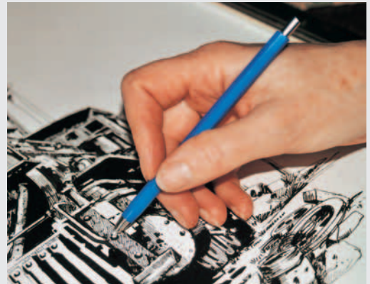
„Standard“ – Bearbeiten von Tuschezeichnungen o.ä.

Für feine Arbeiten, z.B. Reinigen und Entfernen von Tusche-/Tinte und Bleistiftstrichen auf Transparentpapier, Karton, Metall o.ä.; Einsatz: Glasfaser