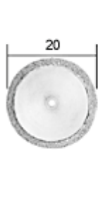
NO 28 840